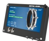
System Elektronicznej Kontroli Kompensatorów